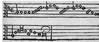
Abb. 4: Die zehen gebot nach Maler: ErfM 1524, Faks.1848, Bl. A2r (vgl. Anm. 11).

Bei Maler befindet sich der C-Schlüssel nicht auf der vierten, sondern auf der dritten Linie, und das in der ersten Zeile korrekt (zum Schlüssel auf der vierten Linie) gesetzte b fehlt am Anfang der zweiten Notenzeile. 8